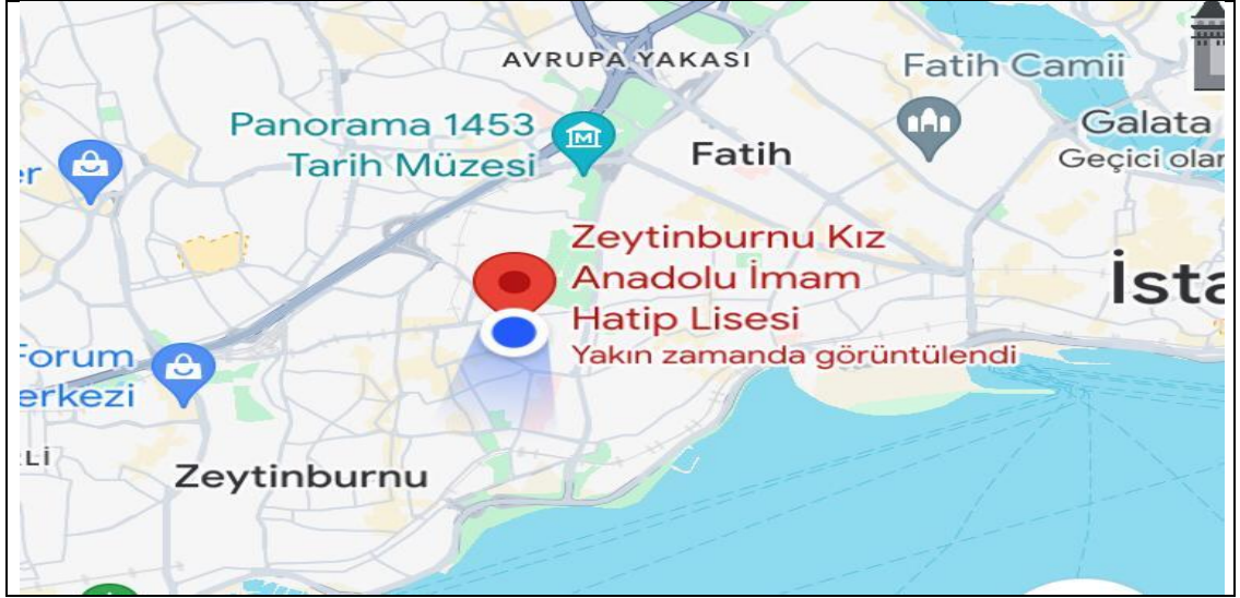
TABLO11: Okulumuza ulaşım

Metro, Tramvay, Otobüs ve Minibüs Duraklarına oldukça yakın Marmaray İstasyonu ile Tüm metro ağına kolay ulaşım imkanı ile okulumuz merkezi bir lokasyondadır.